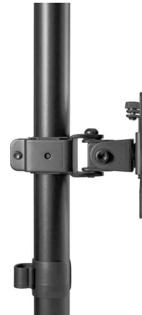
Universal Dual-Monitorarm, Vertikal