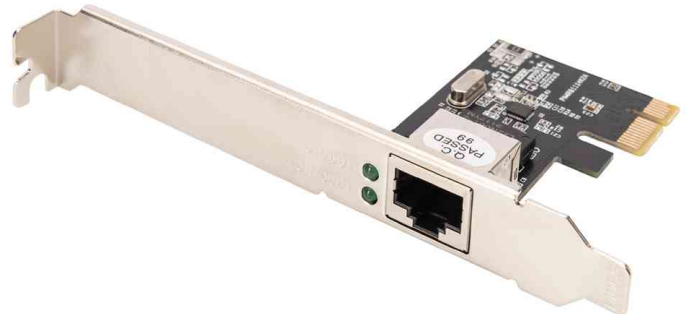
Gigabit Ethernet PCI Express Netzwerkkarte