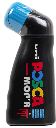
Pigmentmarker POSCA PCM22 MOP'R, hellblau