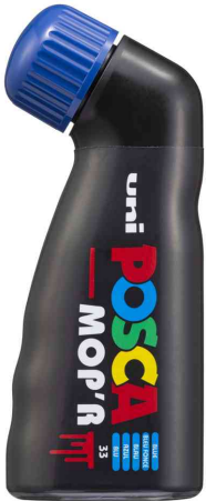
Pigmentmarker POSCA PCM22 MOP'R, dunkelblau