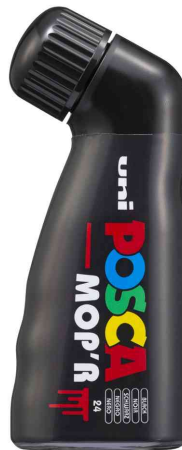
Pigmentmarker POSCA PCM22 MOP'R, schwarz