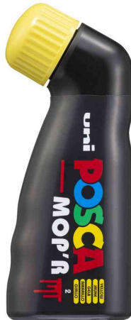
Pigmentmarker POSCA PCM22 MOP'R, gelb