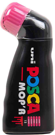
Pigmentmarker POSCA PCM22 MOP'R, pink