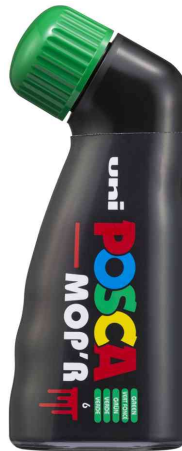
Pigmentmarker POSCA PCM22 MOP'R, grün