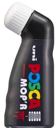
Pigmentmarker POSCA PCM22 MOP'R, weiß