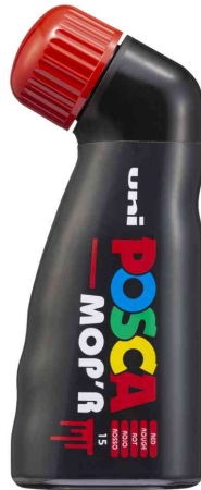
Pigmentmarker POSCA PCM22 MOP'R, rot