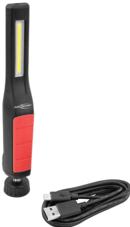
LED Akku-Arbeitsleuchte IL230R