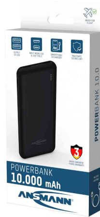
Mobiler Zusatz Akku PB212, 10.000 mAh