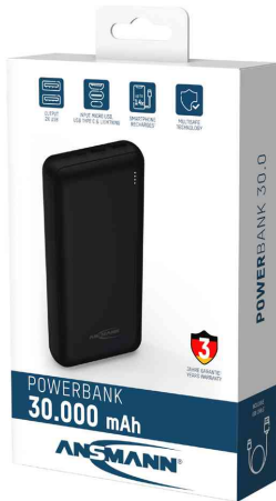
Mobiler Zusatz Akku PB212, 30.000 mAh