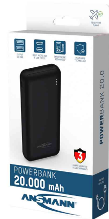
Mobiler Zusatz Akku PB212, 20.000 mAh