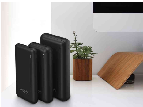
Mobiler Zusatz Akku PB212, Gruppenbild