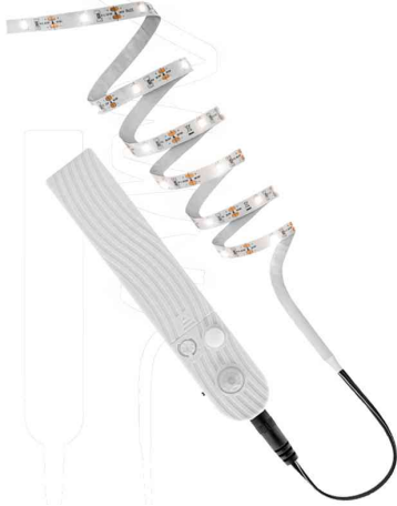
LED-Band mit Sensor