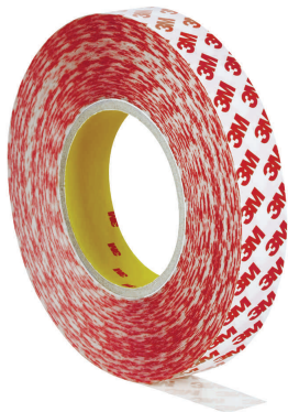
Doppelseitiges Universal-Klebeband GPT-020F, 25 mm