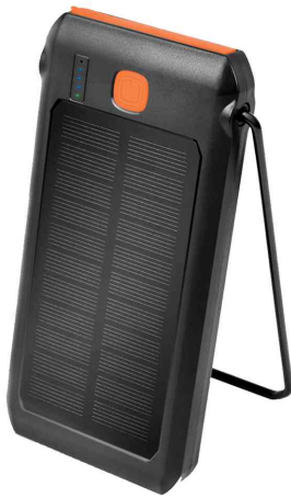
Mobiler Zusatzakku mit Solar