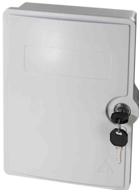
FTTH / FTTB-Anschlussgehäuse