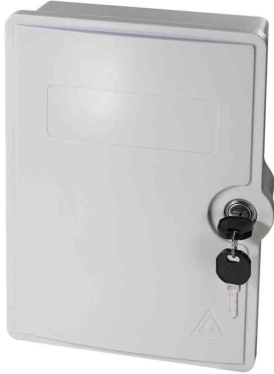
FTTH / FTTB-Anschluss-Leergehäuse