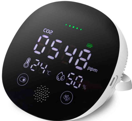
CO2-Messgerät, Temperatur- & Luftfeuchtigkeitsanzeige