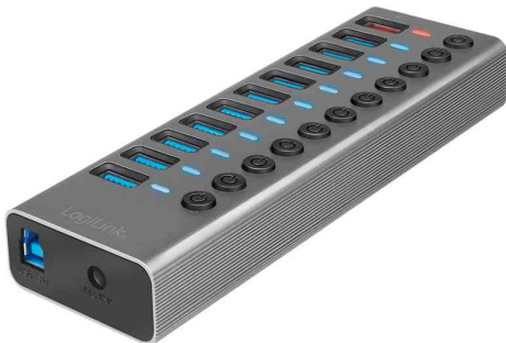
USB 3.2 Hub Gen1, 10 Port + 1 Schnell-Ladeport