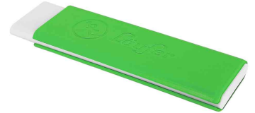
Kunststoff-Radierer Pocket 2, grün