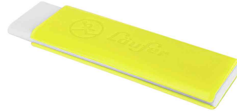
Kunststoff-Radierer Pocket 2, gelb