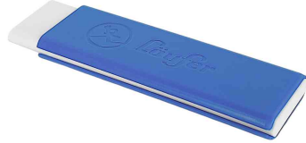
Kunststoff-Radierer Pocket 2, blau