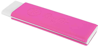
Kunststoff-Radierer Pocket 2, pink

- optimal für Kinder und Schüler geeignet