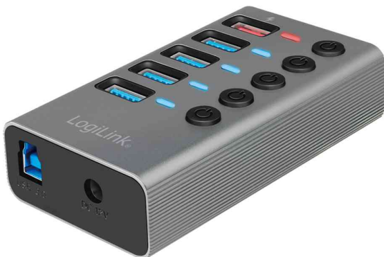
USB 3.2 Hub Gen1, 4 Port + 1 Schnell-Ladeport