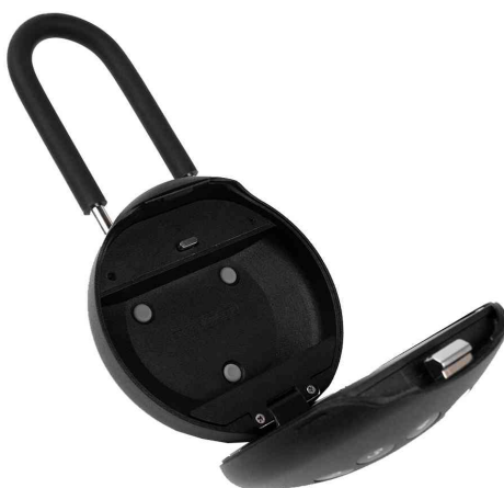
Schlüsselbox PALM KS0213ES, mit Schlossbügel