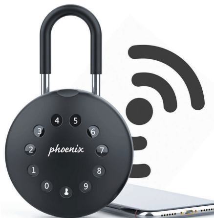
Schlüsselbox PALM KS0213ES, mit Schlossbügel