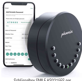
Schlüsselbox SMILE KS0215ES per App programmieren und/oder öffnen