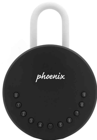
Schlüsselbox SMILE KS0215ES, mit Schlossbügel