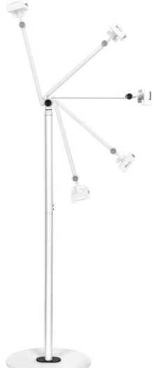
Standfuß für Mobilgeräte

- optimal im Wohnzimmer, Schlafzimmer, in der Küche, im Büro, im Klassenzimmer usw.