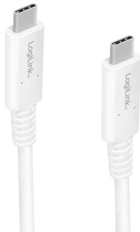
USB 4 Gen 3 Daten- & Ladekabel