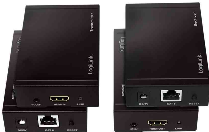
4K HDMI Extender Set über LAN