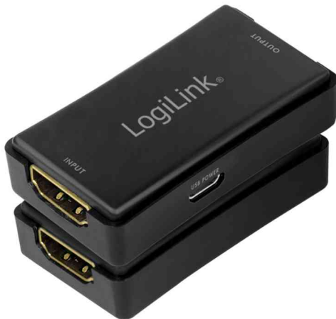
4K HDMI Signalverstärker