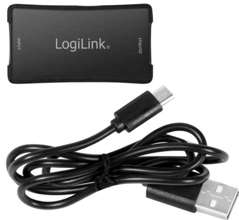
4K HDMI Signalverstärker, inkl. Micro USB-Kabel