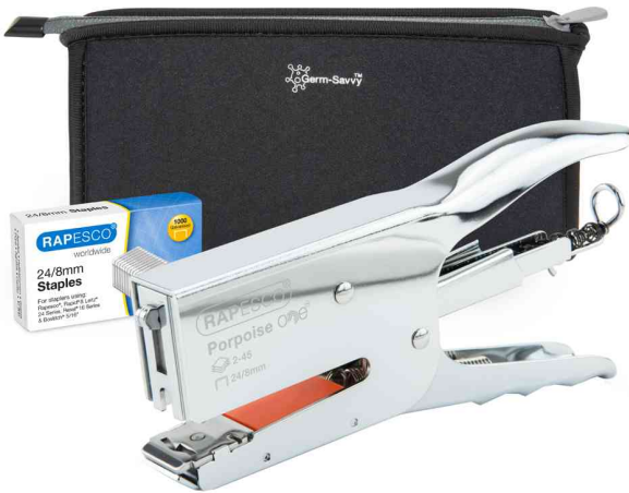
Heftzange Porpoise ONE inkl. Zubehör