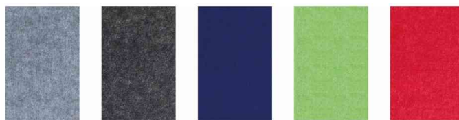
Wandpaneel Infinity Wall X Acoustics - Farben