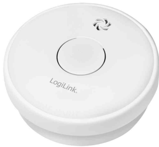
Rauchmelder, inkl. 9 Volt Zink-Kohle-Batterie

Lieferumfang: Rauchmelder, Montagmaterial, 9 Volt Zink-Kohle-Batterie & Bedienungsanleitung