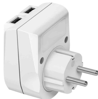
Adapterstecker mit 2 USB-Ports, Rückansicht