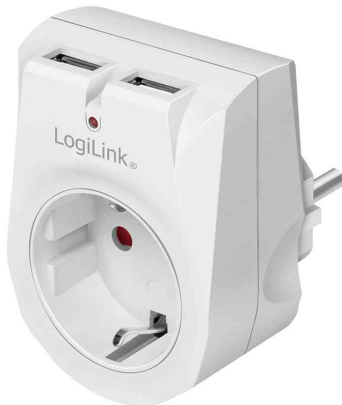
Adapterstecker mit 2 USB-Ports