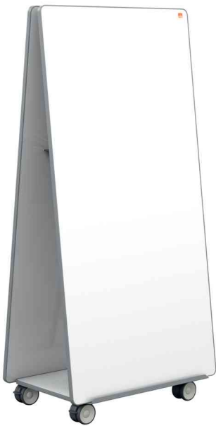
Mobiles Weißwandtafel-System Move & Meet