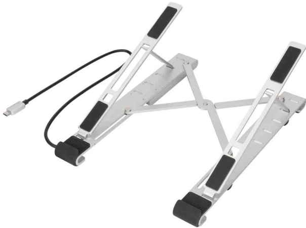
Notebook-Ständer mit integrierte USB-C Hub