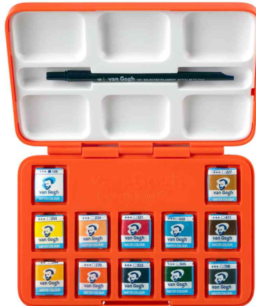
Van Gogh Aquarellfarben Pocket Box "Selbstportrait", offen