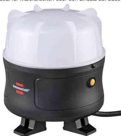
Mobiler 360° LED-Strahler