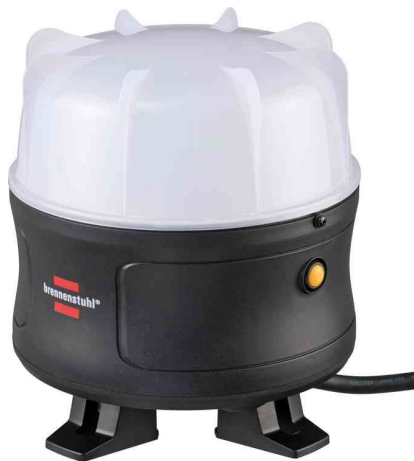
Mobiler 360° LED-Strahler