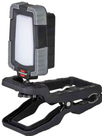
Klemmbarer Akku LED-Strahler CL 1050 MA