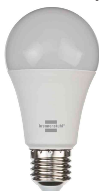
Smarte LED-Lampe SB 800

Anwendungsbeispiele: - für eine smarte Beleuchtung im ganzen Haus