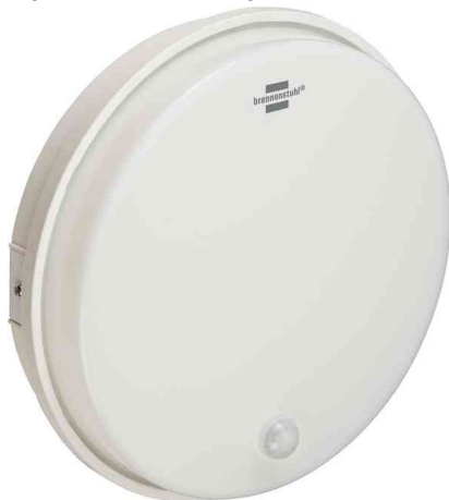
LED Rundleuchte RL 1650 P