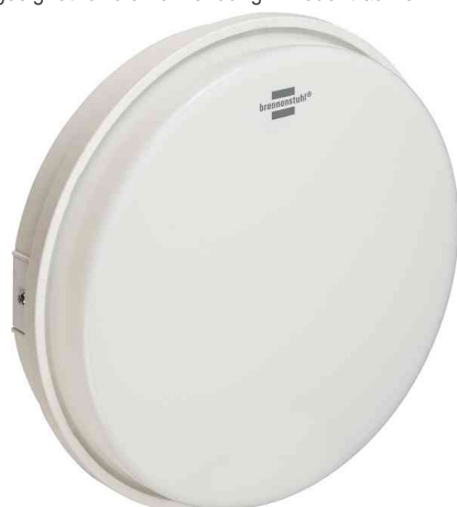
LED Rundleuchte RL 1650