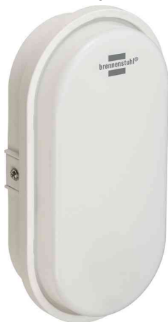
LED Ovaleuchte OL 1650