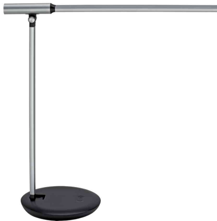
LED-Tischleuchte MAULrubia colour vario