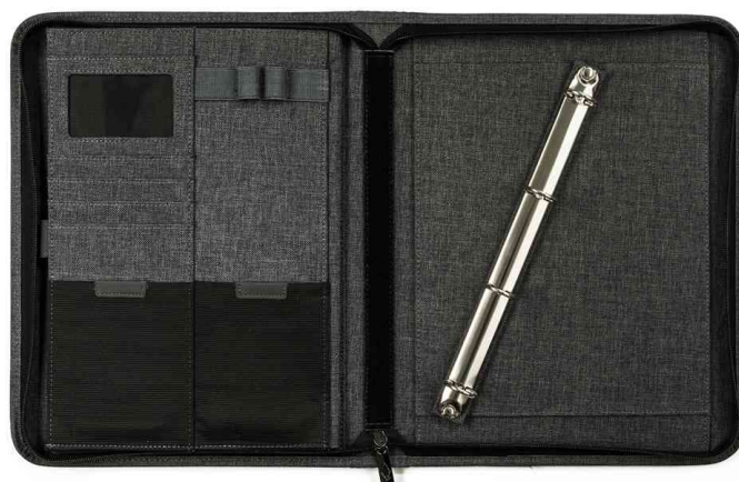
Ringbuchmappe COLLEGE, DIN A4