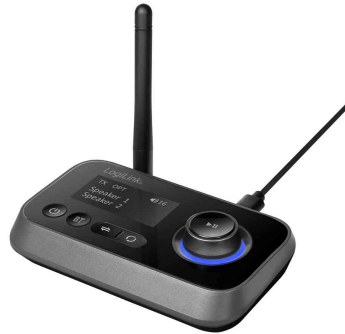
Bluetooth 5.0 Audio Receiver & Transmitter