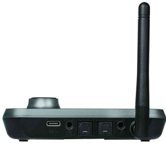
Bluetooth 5.0 Audio Receiver & Transmitter

Anwendungsbeispiele:- kabellose Übertragung von Musik auf die Stereoanlage Zuhause