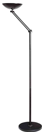
LED-Deckenfluter FIRST ARTICULATED