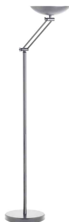
LED-Deckenfluter DELY 2.0 ARTICULATED, metallgrau