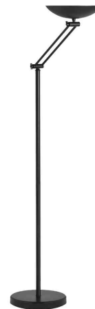
LED-Deckenfluter DELY 2.0 ARTICULATED, schwarz