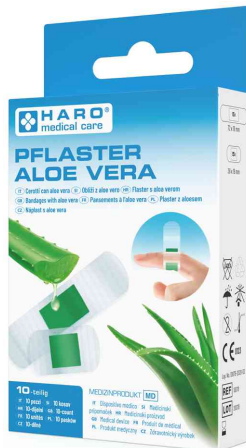
Pflaster-Strips "Aloe Vera"