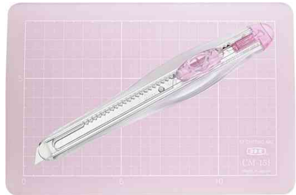
Cutter und Schneidmatten-Set AM350P, rosa