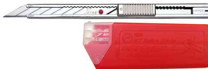
Cutter AD-2P und Klingen BAD-21P