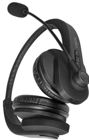
Bluetooth 5.0 Headset, stereo