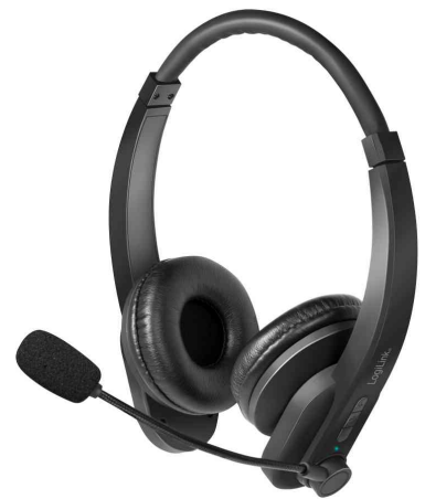
Bluetooth 5.0 Headset, stereo