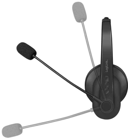
Bluetooth 5.0 Headset, stereo