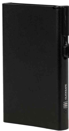
Kartenetui mit Clickbutton & RFID-Schutz, schwarz