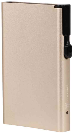
Kartenetui mit Clickbutton & RFID-Schutz, champagner