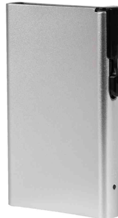
Kartenetui mit Clickbutton & RFID-Schutz, silber