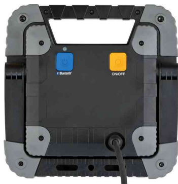
Mobiler LED-Strahler TORAN, IP55, Rückansicht