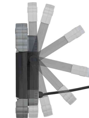
Mobiler LED-Strahler TORAN, IP55, Seitenansicht