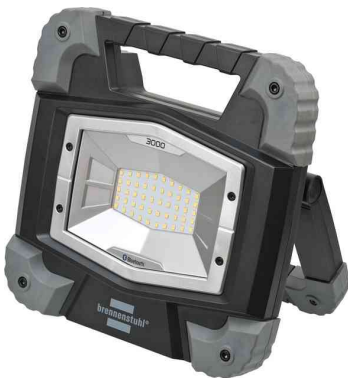
Mobiler LED-Strahler TORAN, IP55