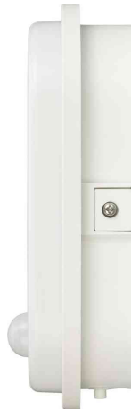
LED Ovaleuchte, mit Infrarot-Bewegungsmelder, Seitenansicht