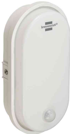
LED Ovaleuchte, mit Infrarot-Bewegungsmelder