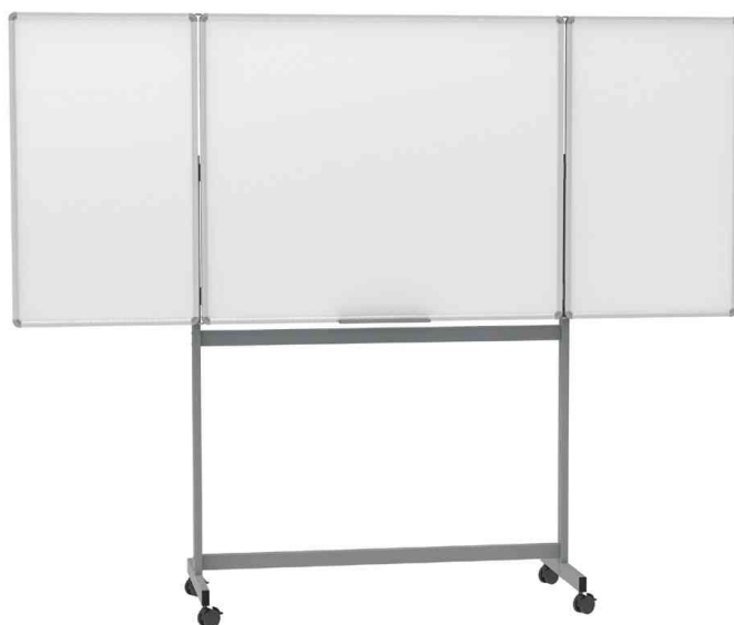
Mobile Klapptafel MAULstandard, offen