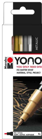
Acrylmarker-Set "YONO" METAL - 0,5 - 1,5 mm