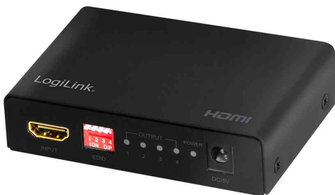
4K/60 Hz HDMI Splitter, Downscaler, EDID, 4-fach

- ermöglicht es bis zu 4 HDMI Bildschirme an nur einem HDMI Anschluss zur gleichen Zeit zu betreiben