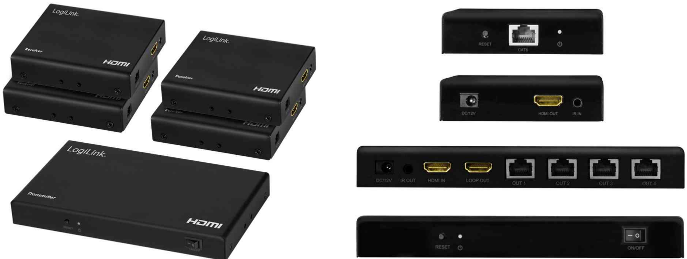
4K/60 Hz HDMI Extender / Splitter Set over IP